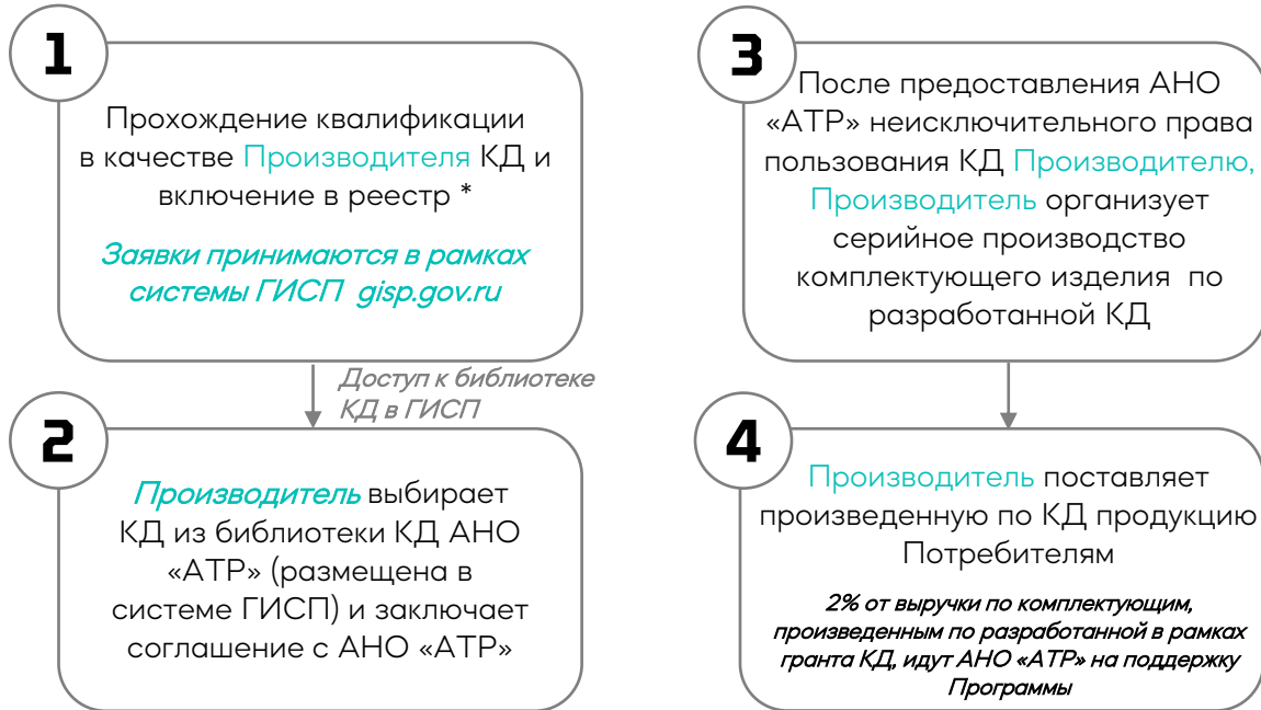
Схема взаимодействия с Производителем

* Дает дополнительную возможность участвовать в совместной реализации проектов по разработке КД совместно с Исполнителями (в случае если Исполнитель не является Производителем , при подаче документов на конкурс, он должен заключить меморандум о сотрудничестве с квалифицированным Производителем ), при этом одно юридическое лицо может быть как Исполнителем (грантополучателем), так и Производителем